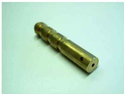
Figuur 2.3 zettingbout

In een eerder stadium zijn op diverse plekken in de fundering/gevel van de panden van rak 12 t/m 15 zettingsboutjes aangebracht zoals weergegeven in (figuur 2.3). De zettingsboutjes zijn door Wiertsema & Partners aangebracht. De locaties van de zettingsboutjes zijn weergegeven op bijlage 1.